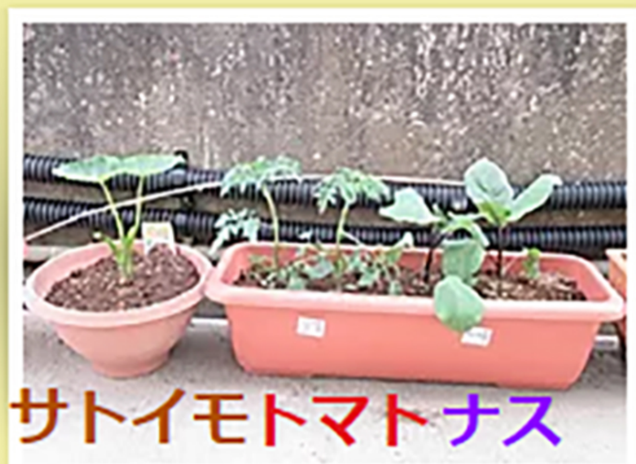
サトイモ トマト ナス

子ども達と一緒に野菜の苗を植えました！サトイモ、トマト、ナス、えだまめ、きゅうり、ナス実るのが楽しみです(*^▽^*)