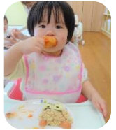
離乳食も“鬼ランチ”